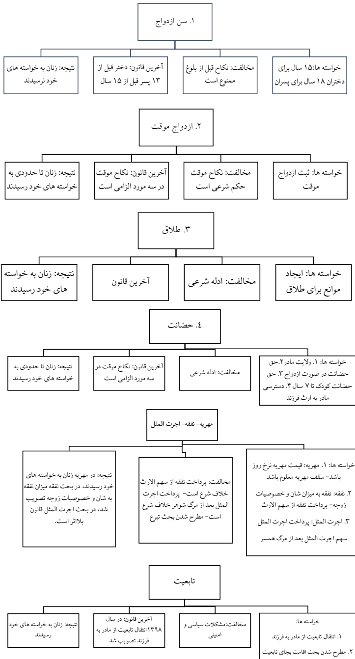
شکل ۲. خواسته‌ها و نتایج به دست آمده: خرده‌مقوله